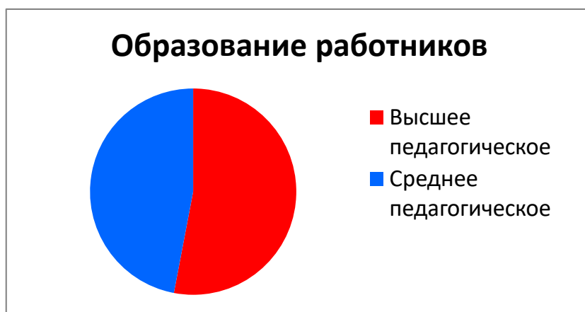
Диаграмма с характеристиками кадрового состава МКДОУ детский сад «Колокольчик»

По итогам 2020 года МКДОУ детский сад «Колокольчик» перешел на применение профессиональных стандартов. Из 9 педагогических работников детского сада все соответствуют квалификационным требованиям профстандарта «Педагог». Их должностные инструкции соответствуют трудовым функциям, установленным профстандартом «Педагог».